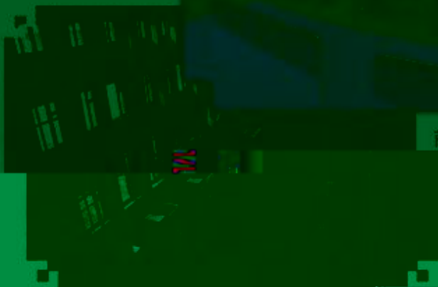
商贸管理类专业 综合训练场所